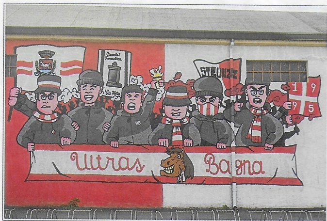
Il nuovissimo e bellissimo murales degli ultras biancorossi (da far invidia in categorie superiori!...)