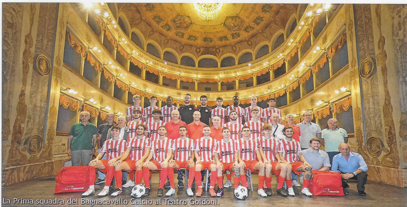
La Prima squadra del Bagnacavallo Calcio al Teatro Goldoni.