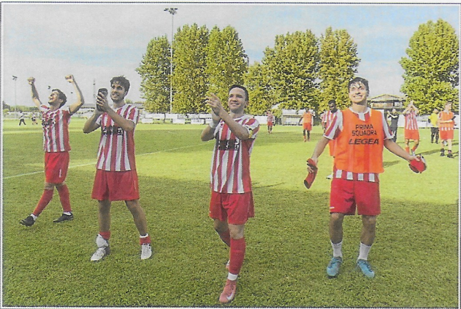
...e a fine partita tutti sotto la curva a festeggiare con gli ultras la prima vittoria in casa del bagna!...