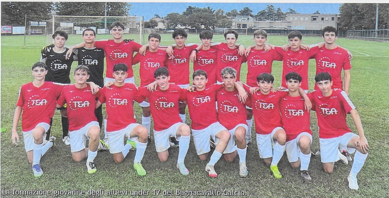
La formazione giovanile degli allievi under 17 del Bagnacavallo Calcio.